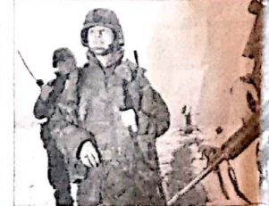
Una mujer en la guerra, participando en el conflicto de los Balcanes.

En países como Austria, Portugal, Francia, Australia, Italia o España, diversas asociaciones de mujeres han denunciado que la situación de las mujeres, lejos de mejorar, ha empeorado. Basta con mencionar, recordaron, que las mujeres ganan menos que los hombres por el mismo tipo de funciones,